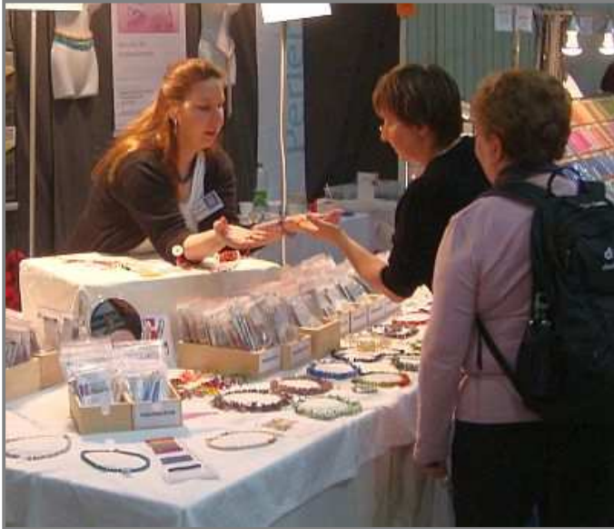
Vorführung von Schmucktechniken